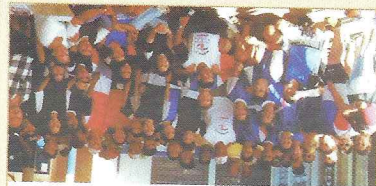
ETE PREFEITO ALBERTO FERES Araçás - 01 a 03/06