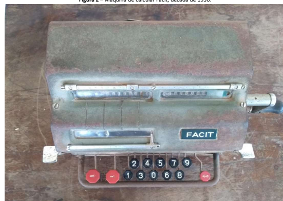
Acervo do Centro de Memória da Etec “Dr. Carolino da Motta e Silva” Fotografia: Kátia Vargas Abrucese, em 2021.

A máquina de calcular foi um importante instrumento para os funcionários que trabalhavam nos departamentos da Fazenda Escola, na área administrativa, pois agilizava os cálculos, até então efetuados manualmente.